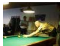
Jean-Marie Vanlandeghem aan het woord euh stoot.