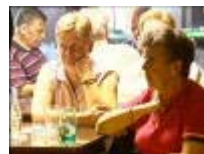
Foto uit TV reportage van WTV De vrouwen volgen vo spanning wat manlief "uitspookt"