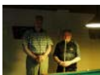
Ook voor de winnaars moest de eigenlijke finale toen nog beginnen,