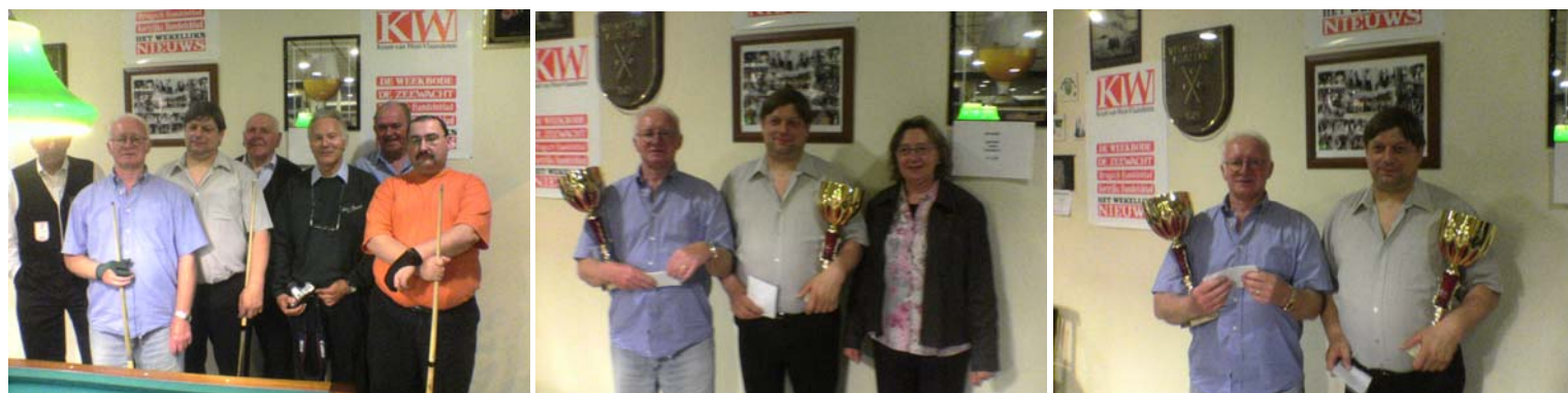
De wedstrijden en uitslagen