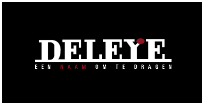
DELEYE, Bruggesteeweg 530 te 8800 Roeselare, tel. 051.221.836