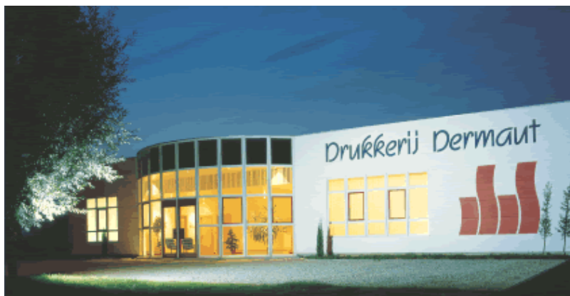
DRUKKERIJ DERMAUT, Industieweg 56, te 8800 Roeselare, tel. 051.240.688